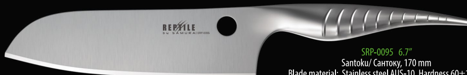
SRP-0095 6.7" Santoku/ Сантоку, 170 mm Blade material: Stainless steel AUS-10, Hardness 60±1 HRC Материал: сталь AUS-10, твердость 60±1 HRC