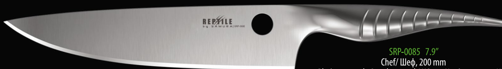
SRP-0085 7.9" Chef/ Шеф, 200 mm Blade material: Stainless steel AUS-10, Hardness 60±1 HRC Материал: сталь AUS-10, твердость 60±1 HRC