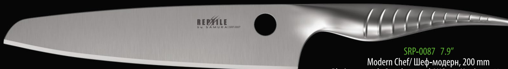
SRP-0087 7.9" Modern Chef/ Шеф-модерн, 200 mm Blade material: Stainless steel AUS-10, Hardness 60±1 HRC Материал: сталь AUS-10, твердость 60±1 HRC