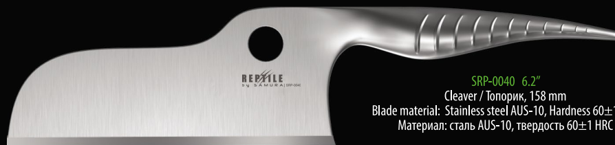
SRP-0040 6.2" Cleaver/ Топорик, 158 mm Blade material: Stainless steel AUS-10, Hardness 60±1 HRC Материал: сталь AUS-10, твердость 60±1 HRC